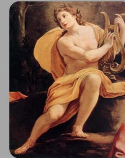
Apolo La música