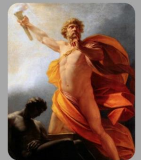
Prometeo La planeación